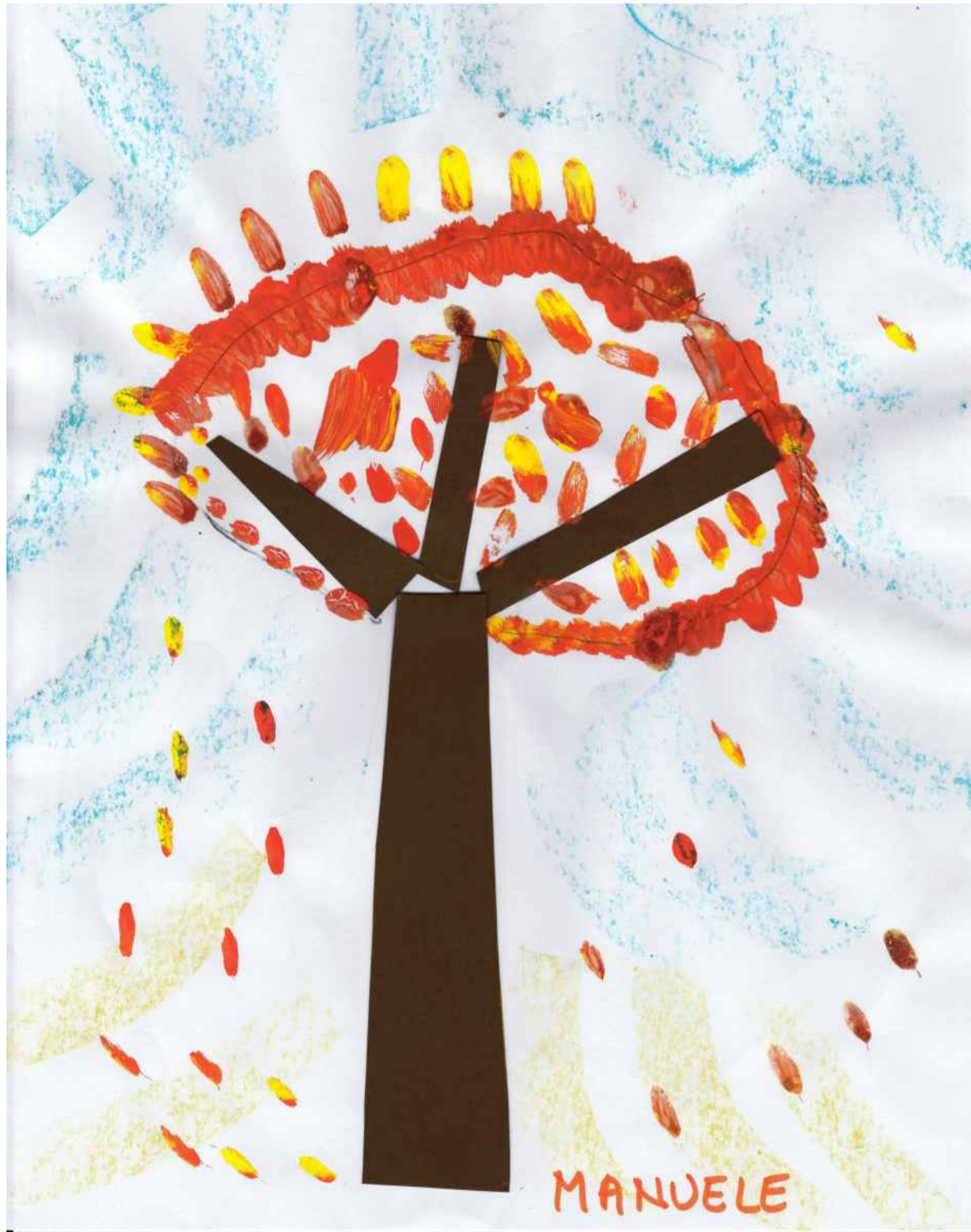
Manuele Mazza: "cadono le foglie" - tecnica mista